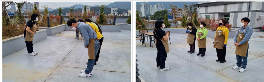
월 2회 친절교육 시행 <2021. 10. 15. 교육사진>