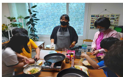
우리콩 콩나물전 만들기