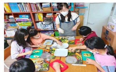
청양채소 월남쌈 만들기