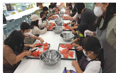
더위썩 수박주스 만들기