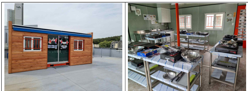
유성점 3층 ‘먹거리식생활체험 교육장’