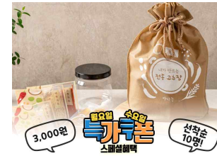
내가 만드는 전통고추장 밀키트