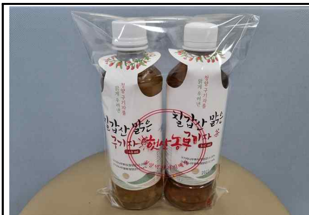
칠갑산 맑은 구기자차(500병 / 단가 1,200원)