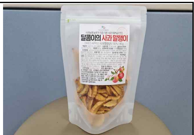
달콤이의 사과말랭이(300봉 / 단가 3,900원)